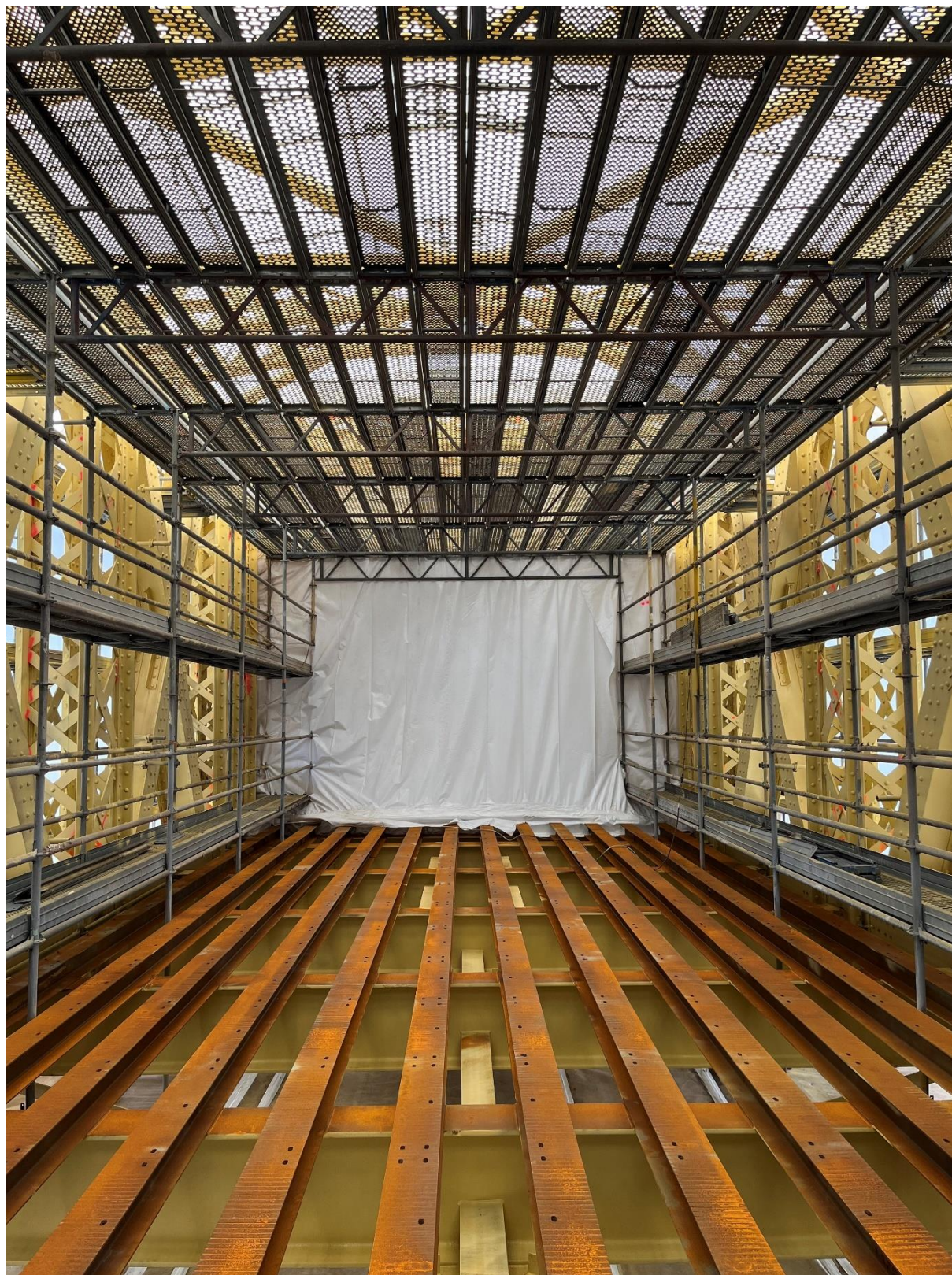
La zone 1 décapée

Enfin, les travaux de chaudronnerie ont débuté. La fabrication des nouvelles tôles pour la réparation du chevêtre a commencé dans les ateliers à Saint-Saulve. A partir de cette semaine, la dépose des rivets des consoles des anciens trottoirs va s'amorcer.