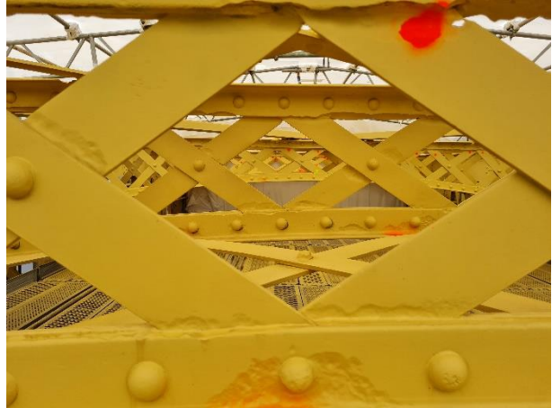
Chaque point rouge ou orange correspond à une zone à réparer et/ou remplacer