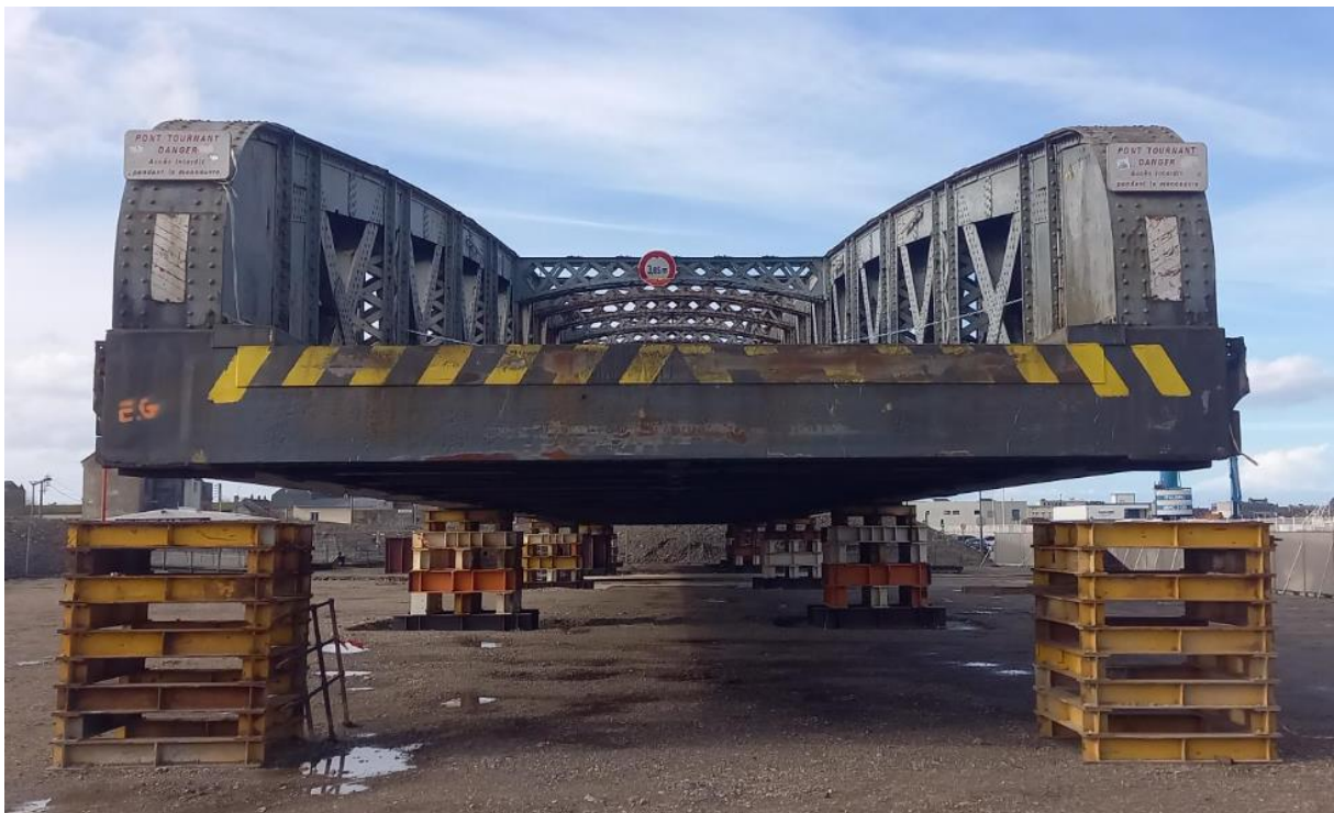
Le pont Colbert sans ses deux trottoirs

Une fois ces opérations terminées, les équipes pourront passer à l'installation de l'échafaudage qui entourera intégralement le pont de manière à permettre d'accéder au moindre recoin pour le décapier. Il restera alors à installer le cocon qui enveloppera le pont afin d'empêcher toute émanation de plomb et d'amiante. Pour ce faire, le cocon sera composé de 2 couches dont une thermo-bâche dont l'étanchéité sera vérifiée par l'intermédiaire d'un test de fumée. Enfin, une unité de décontamination sera installée afin de permettre aux équipes habilitées d'entrer et sortir du chantier sans risque. Le décapage du pont, qui se fera en 3 tranches successives, pourra alors débuter.