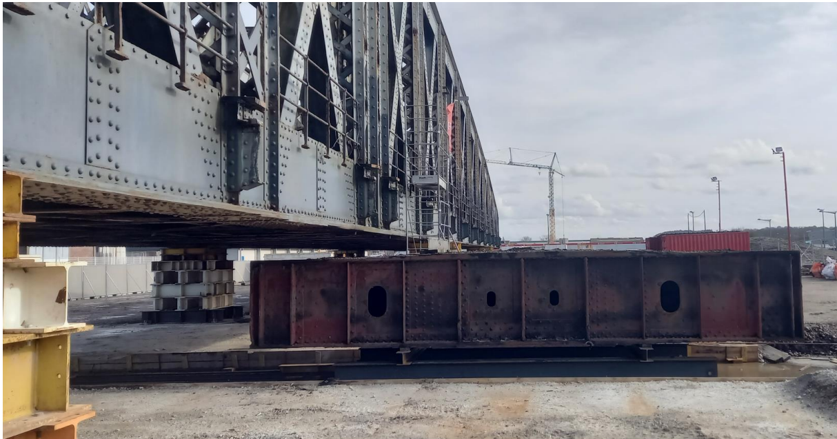
Retrait du chevêtre du Pont Colbert