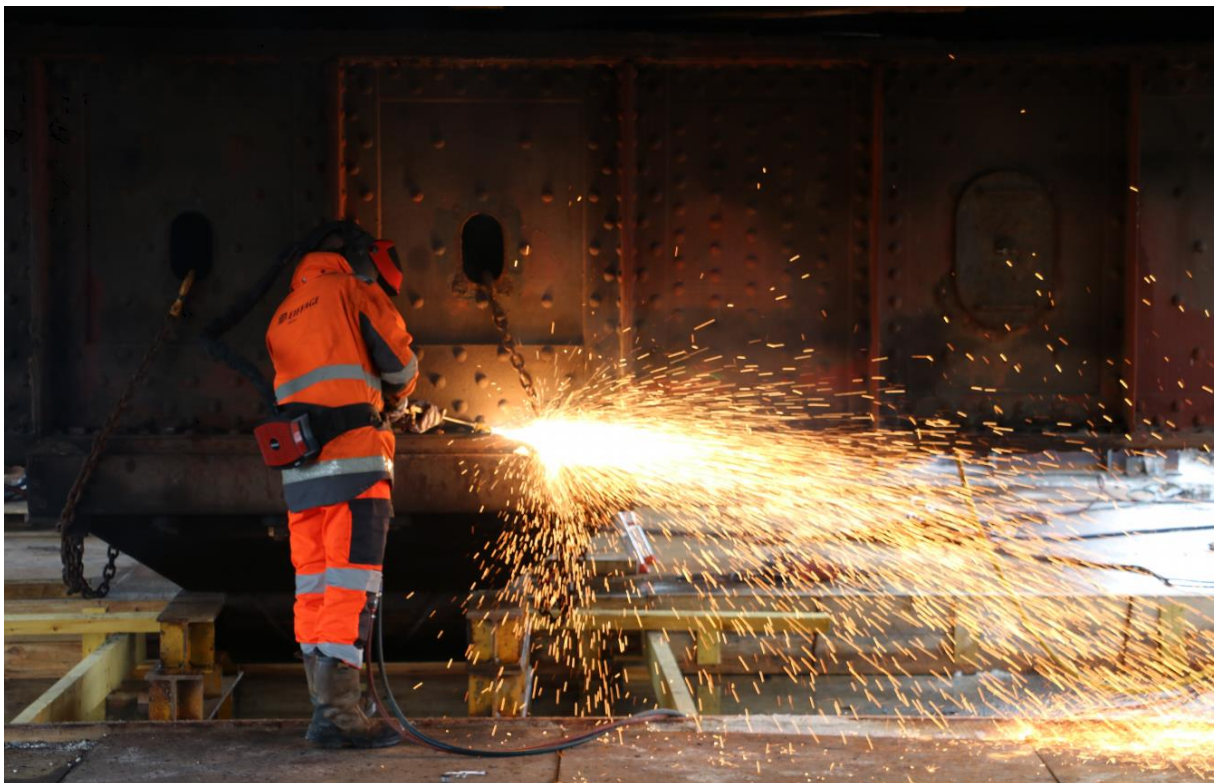
Dépose du pivot du Pont Colbert

Les quatre dernières semaines ont été consacrées au « déshabillage » du pont avant de pouvoir procéder au décapage. Les équipes d'Eiffage ont ainsi retiré les trottoirs qui bordent de chaque côté le pont, le pivot (14,5 tonnes) qui n'avait pu être enlevé avant le transfert du pont ainsi que le chevêtre sur lequel repose le tablier. Actuellement, ce sont les garde-corps ainsi que les caillebotis qui sont en train d'être retirés. Tout cela devrait durer jusqu'à fin mars.