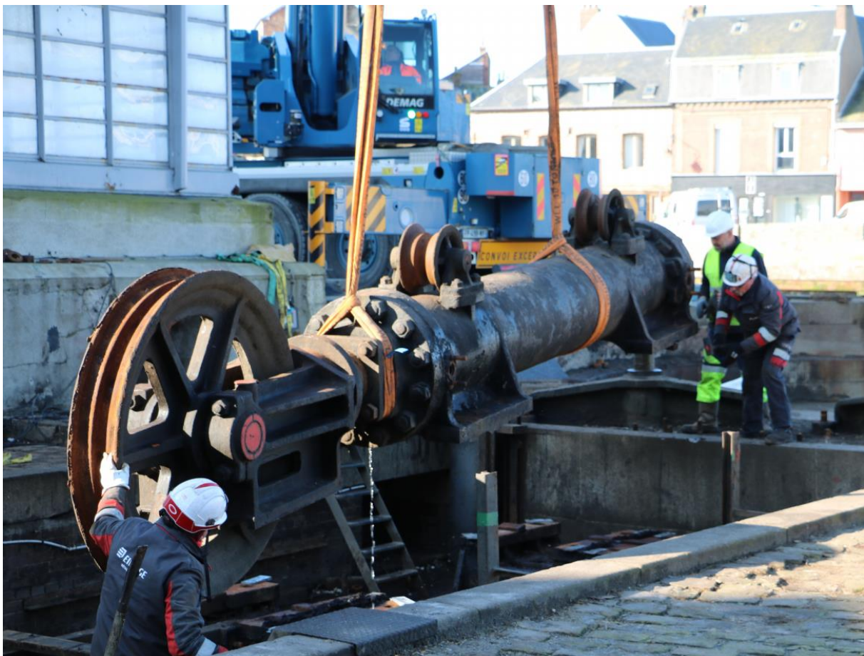
Dépose du mécanisme du Pont Colbert

Ces opérations terminées, les travaux de maçonneries devraient pouvoir débuter le 18 mars prochain : dépôt du pavage, sablage, remplacement des éléments endommagés... Pour mémoire, l'ensemble des travaux de rénovation du mécanisme et des zones de retrait et de manœuvre du pont devrait durer 8 mois.