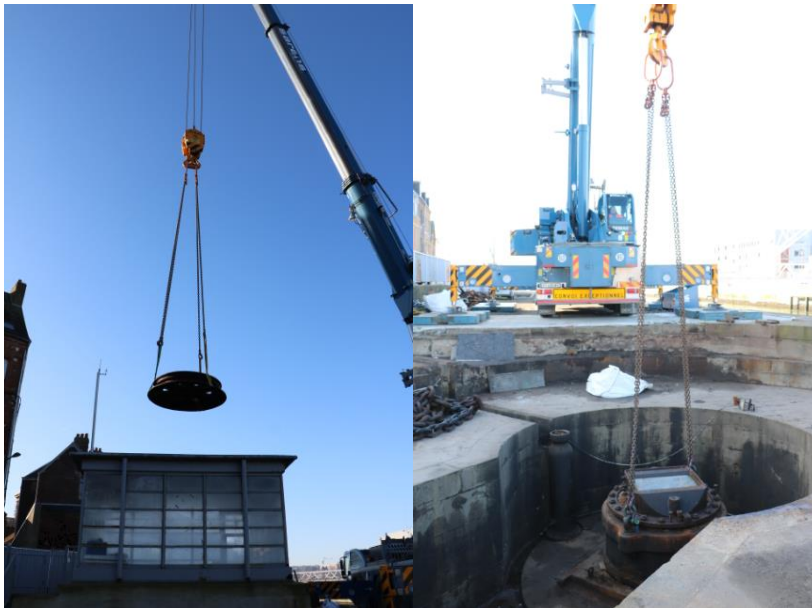
Dépose de la presse de rotation – 12 tonnes

Afin de pouvoir intervenir sur la zone de rotation, les équipes de Ports de Normandie ont commencé par procéder au retrait du fumier qui isole les canalisations du pont. Parallèlement, Eiffage est en train de déposer les organes de manœuvre : presses de levage et de calage, vérins, chaîne et couronne. Les réseaux d'alimentation en eau et en électricité ont également été consignés.